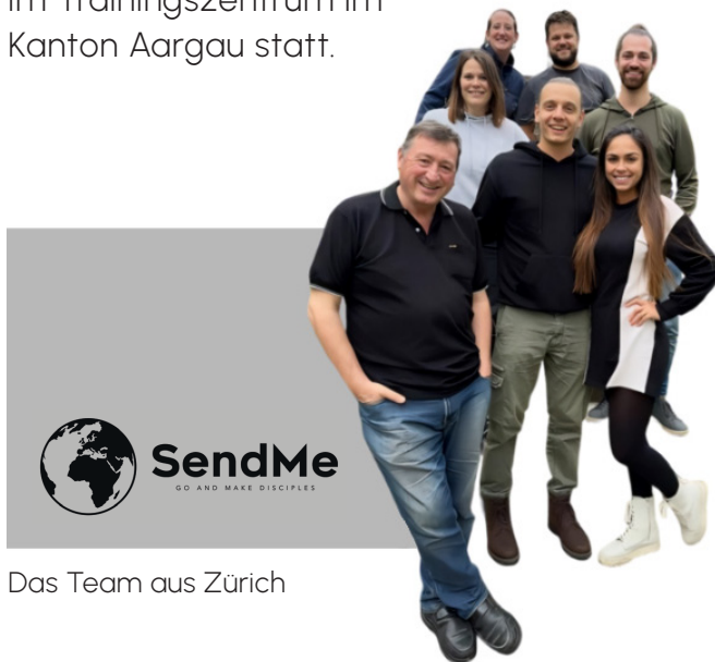
Das Team aus Zürich

Die Trainings am Samstag finden jeweils in Zürich Altstetten, die Trainingsstunden unter der Woche am jeweiligen Wohnort der Teilnehmenden und die Weekends im Trainingszentrum im Kanton Aargau statt.